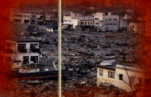
平成23年 東日本大震災